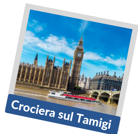
Crociera sul Tamigi