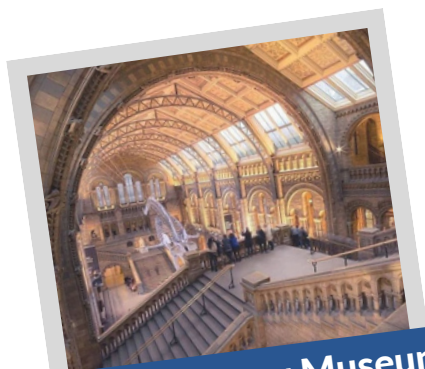
Natural History Museum