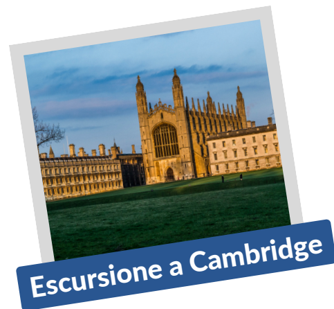
Escursione a Cambridge