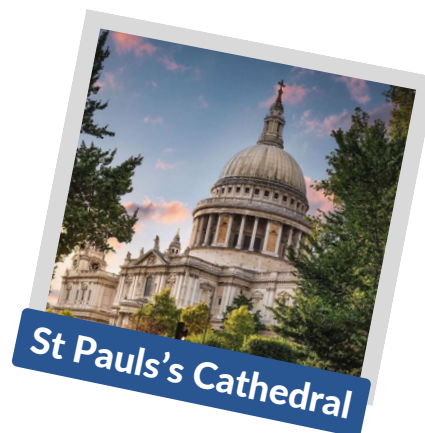
St Paul's Cathedral